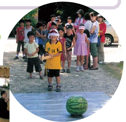
境内で、小さい子どもさんが、一人ずつスイカ割り!