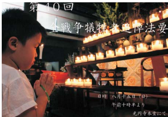
第40回全戦争犠牲者追悼法要 （2010年8月15日）

仏教聖歌、世界の名曲を練習している。随時、寺の法要・行事に賛助出演している。（毎月第2、4、月曜日 夜7時から9時まで 本堂にて）