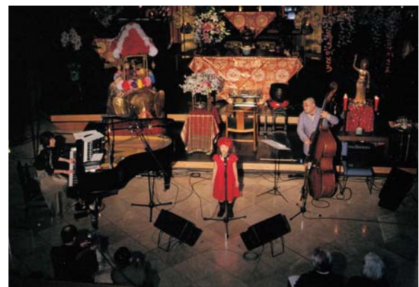
花まつりvisionsコンサート （2010年4月8日）